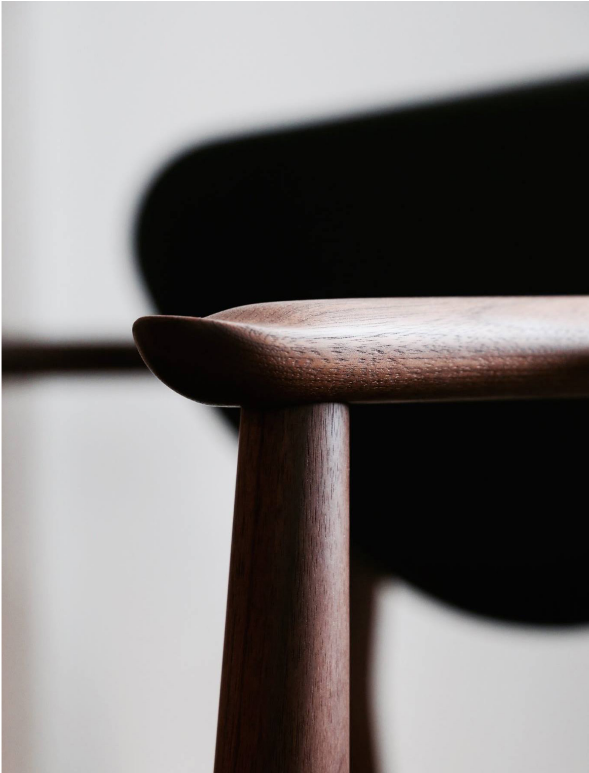
109 ARMSTOL 1946 AF FINN JUHL