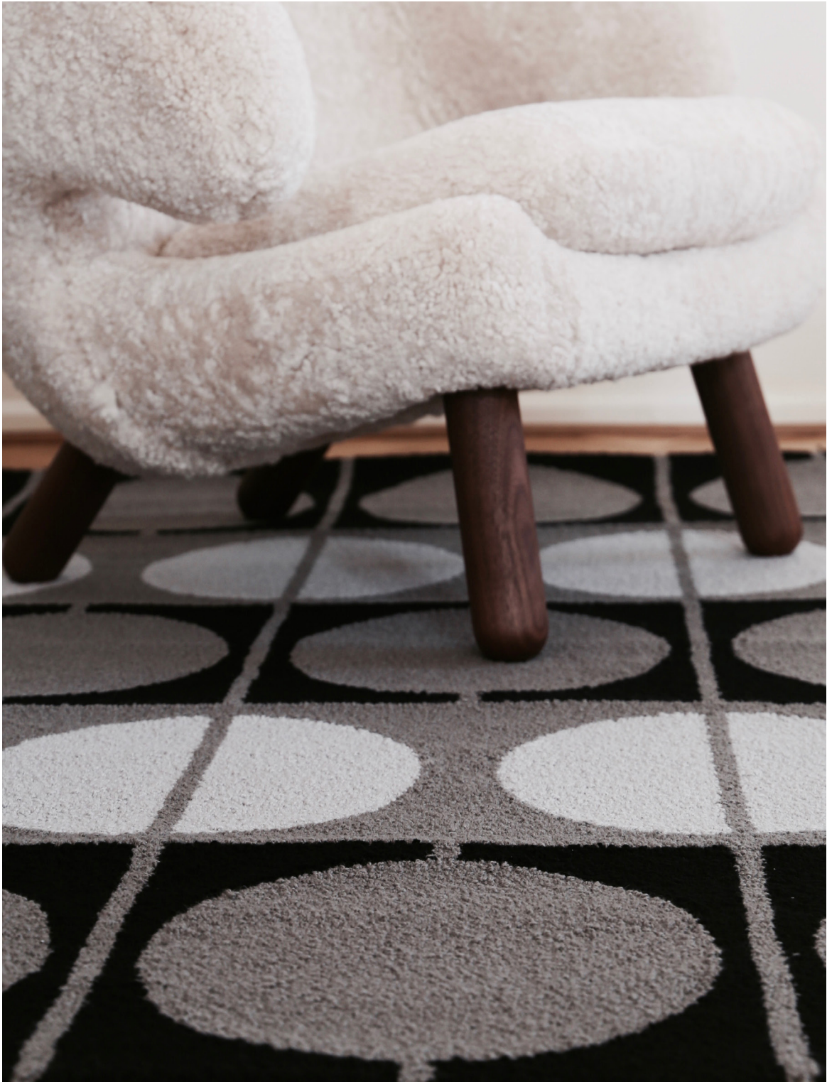
CIRKELTÆPPE 1963 AF FINN JUHL