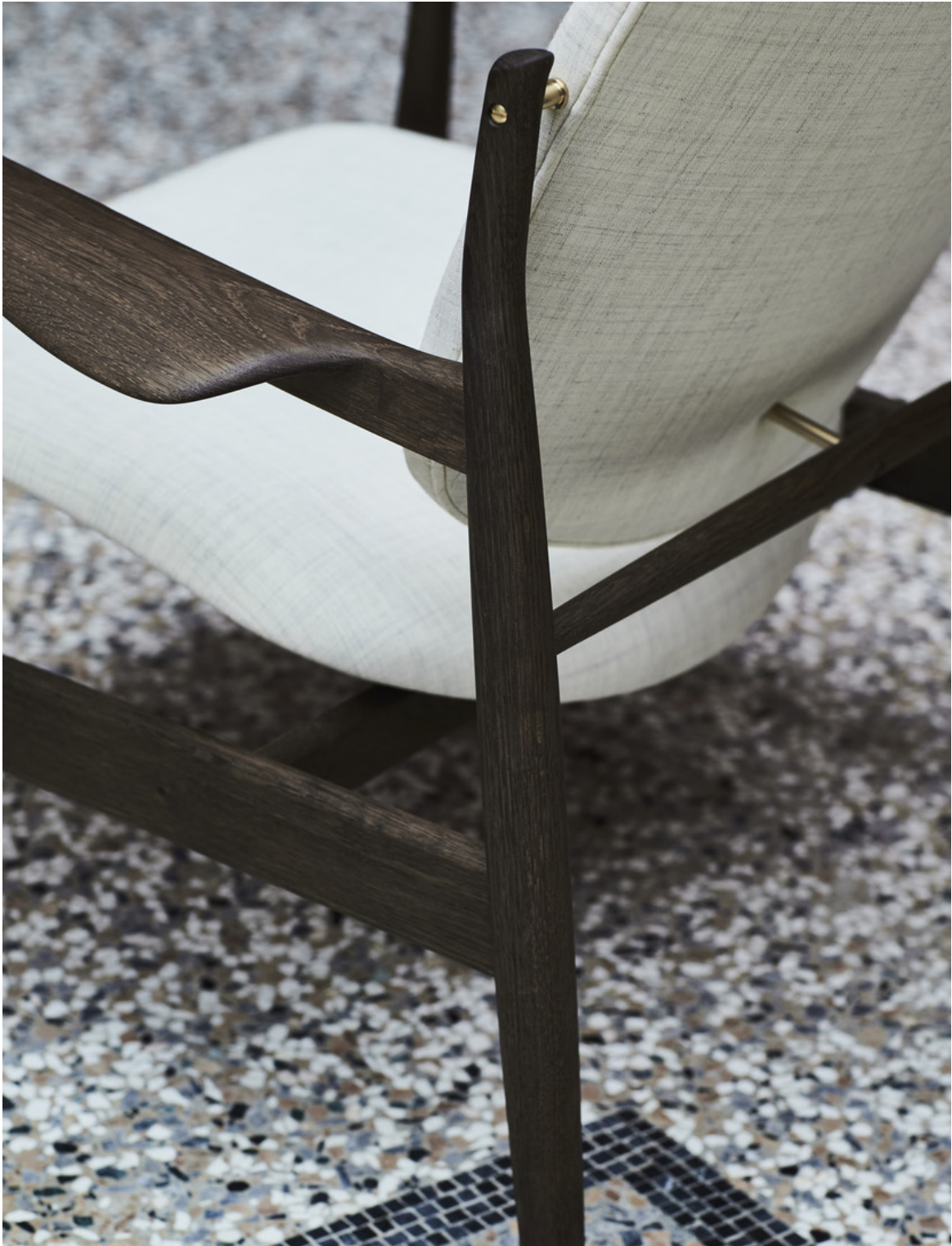
FRANCE STOL 1956 BY FINN JUHL