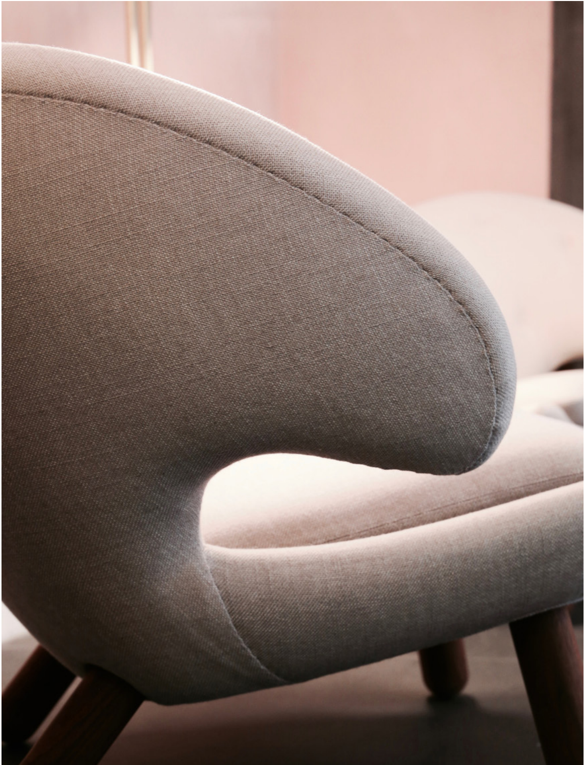
PELIKANSTOL 1940 AF FINN JUHL