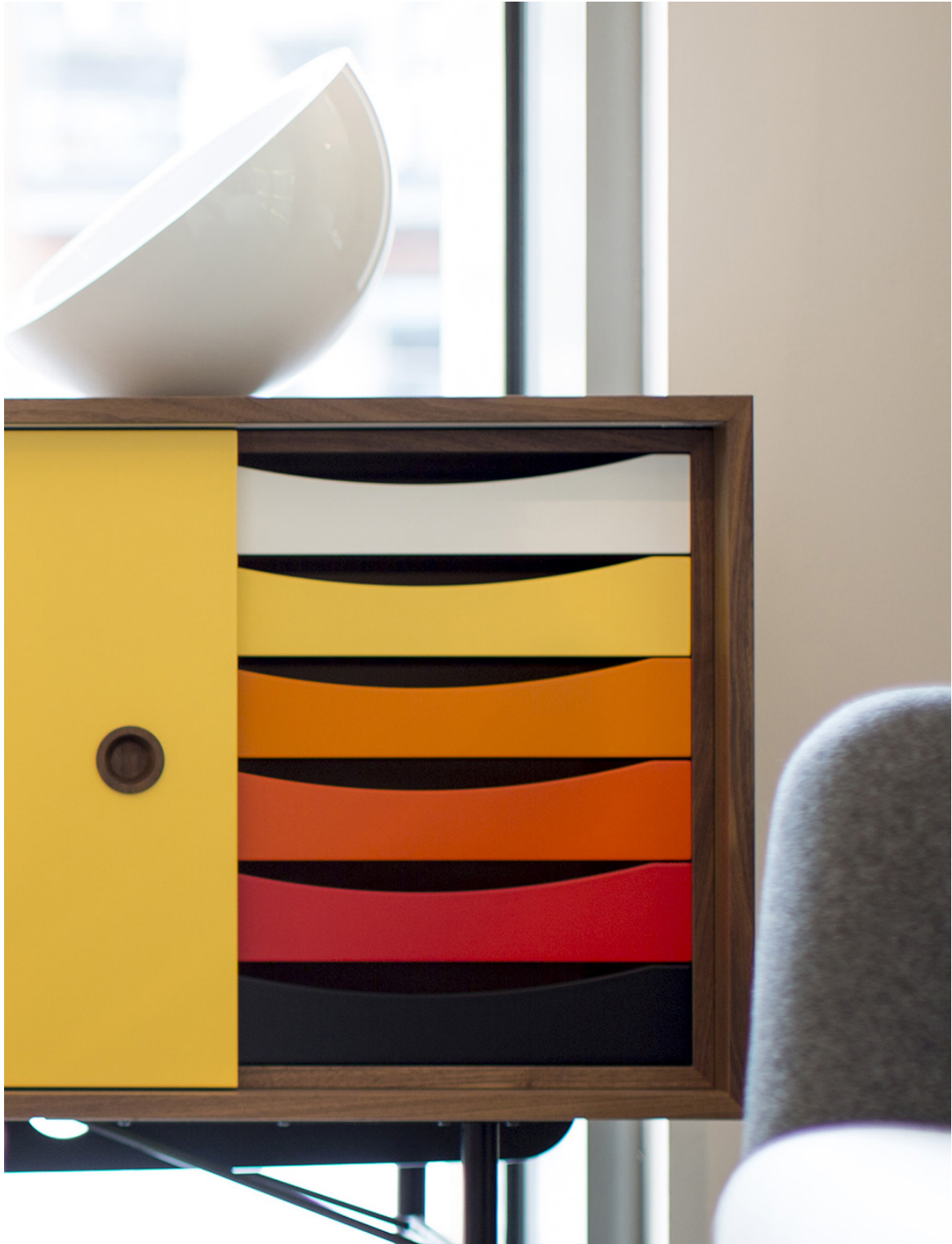
SKÆNK 1955 AF FINN JUHL